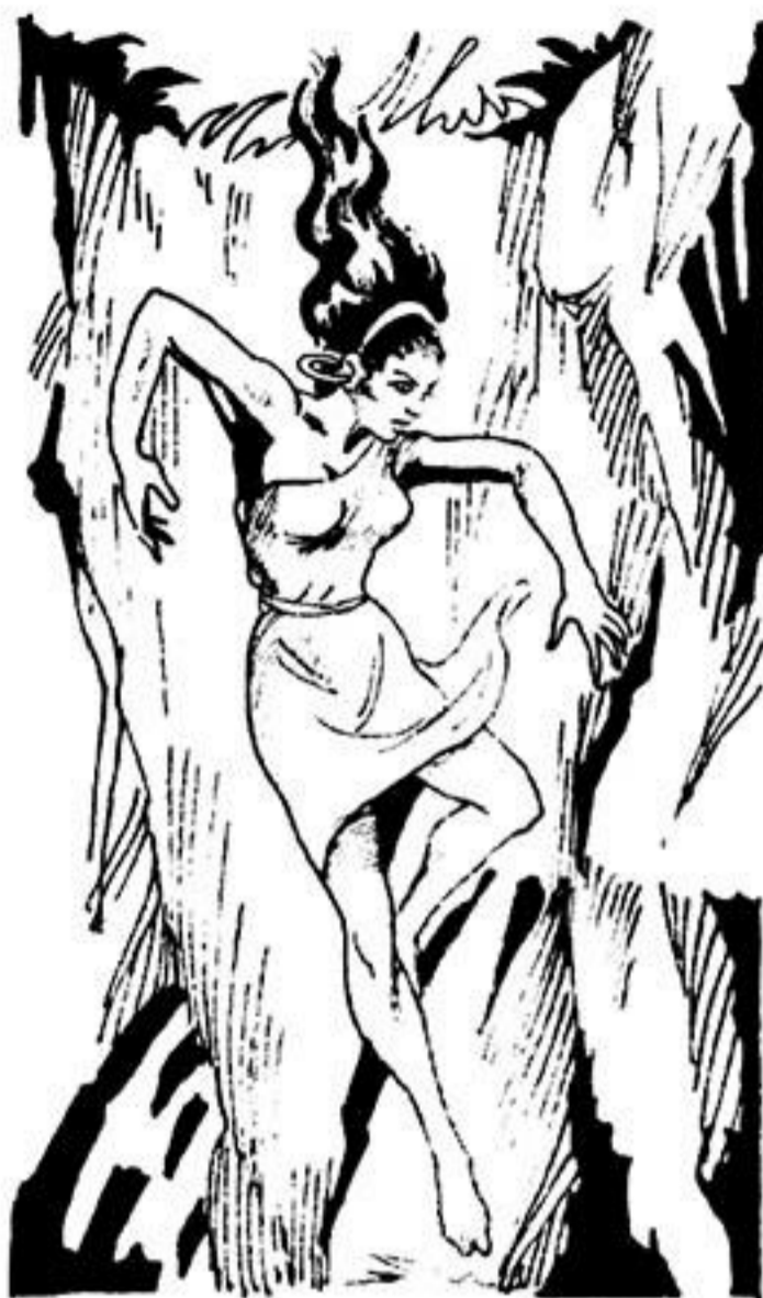
Γιά λίγες στιγμές, βρῖσκεται στόν ἀέρα.

Ὁ ἀτρόμητος βασιλιάς τῆς Ζούγκλας εἶναι ἄοπλος. Βλέπει καθαρά πώς φτάνει ἡ στερνή του στιγμή. Ψηλά, ἀπ' τό γιγαντόσω- μο δέντρο, ἀκούγεται τό στρίγ- γλισμα τῆς Βάτ.