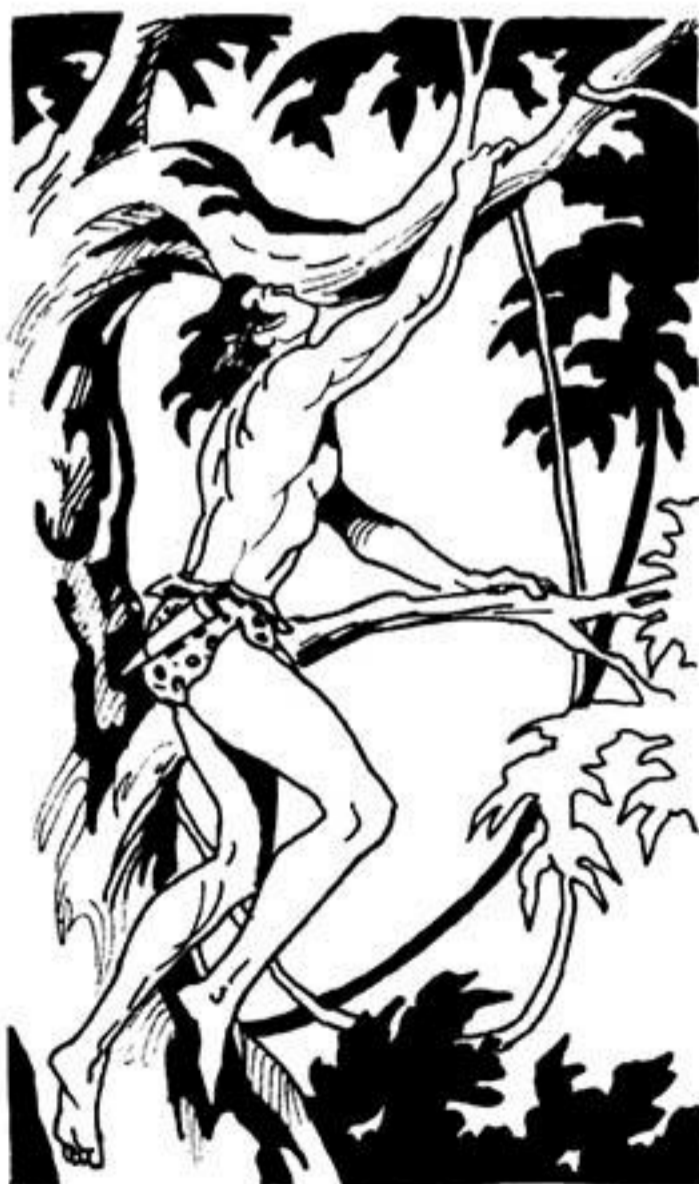
Τά κλαδιά πού πιάνεται ν' ανέβει είναι βρεγμένα καί γλιστερά.