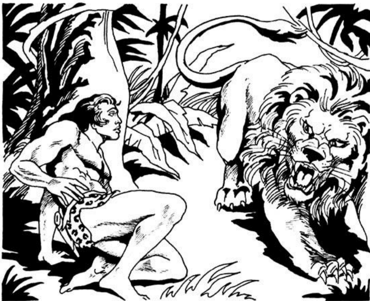
Τό λιοντάρι εἶναι ἐλεύθερο καί παίρνει δυό-τρεις γρήγορες ανάσες.

'Αρπάζει ἓνα μαχαίρι. Βγαίνει μανιασμένη απ' τή σπηλιά. Τρέχει γιά τό μέρος πού ἡ φωνή τῆς