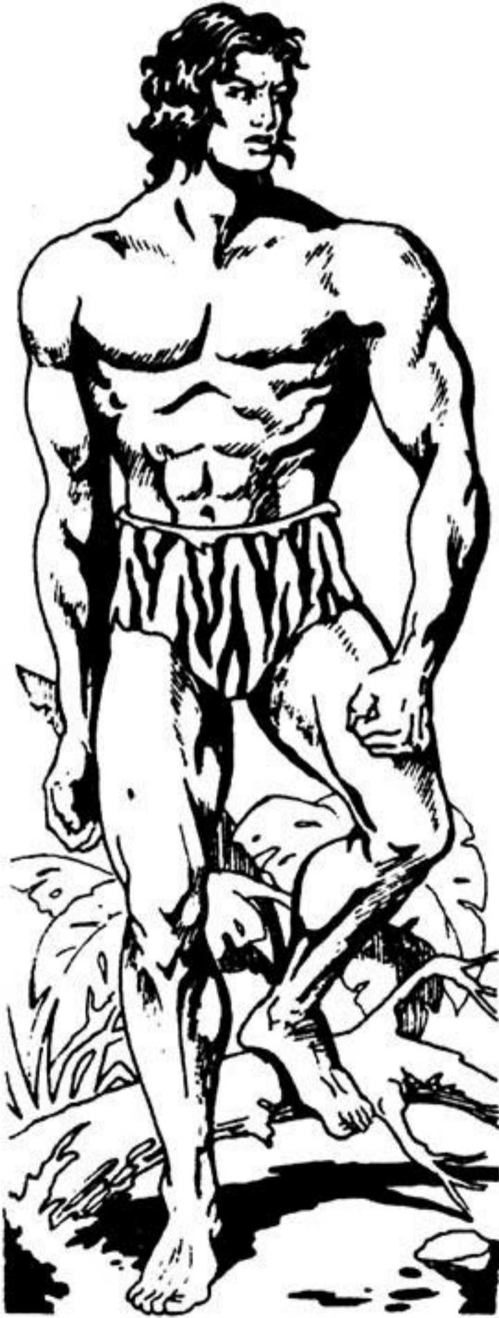
Ο μελαψός γίγαντας

Λίγα λόγια για τό τεύχος No 5 τής σειράς ΓΚΑΟΥΡ- ΤΑΡΖΑΝ: ΣΤΗΝ ΑΓΚΑΛΙΑ ΤΟΥ ΓΟΡΙΛΑ