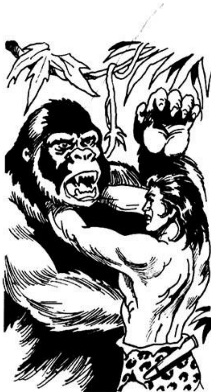
Σφίγγει τό λαιμό του πληγωμένου γορίλα.