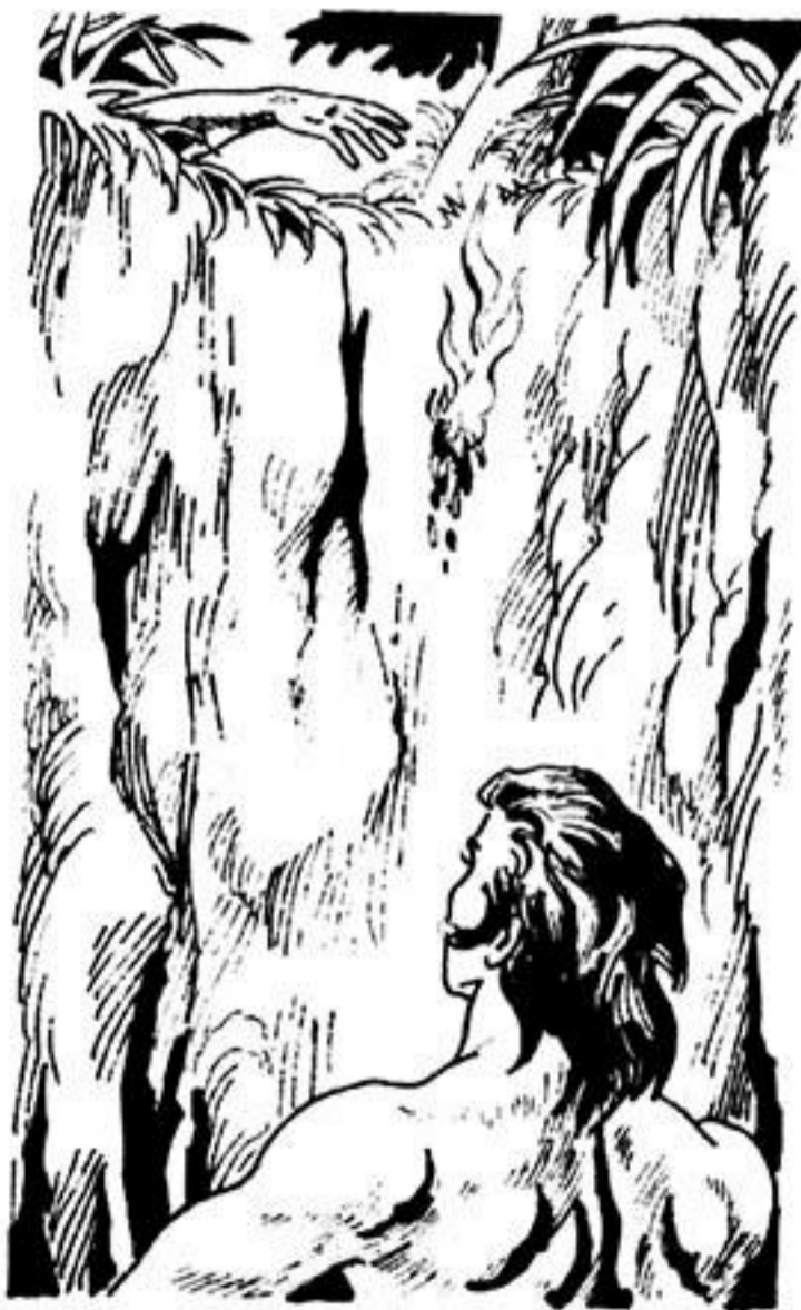
Ένα μεγάλο, μελαψό χέρι ρίχνει κάτω μιά φούχτα φυλλα αναμμένα.