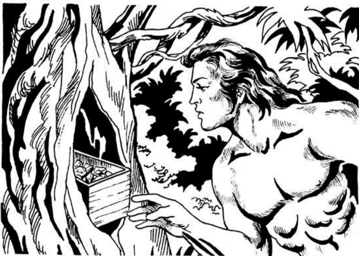
Σέ μιά στενή κουφάλα βρίσκει ἀθικτο τό κασονάκι μέ τά πολύτιμα πετράδια.

Ἦστερα ἐξηγεῖ στή Λιόγκα πώς ἡ λευκή ἦταν ἀθώα. Πώς δέν εἶχε κλέψει τά πολύτιμα πετράδια. Μά τά ἔχε κρύψει γιά νά μήν τά πάρει ὁ κακός