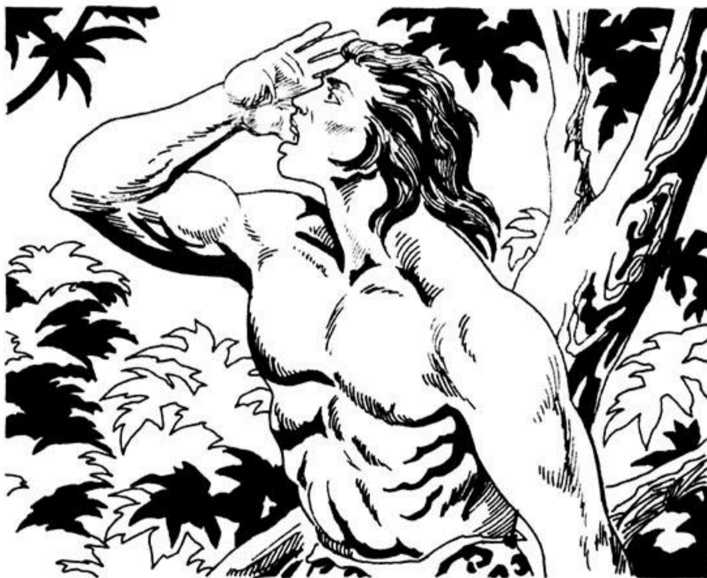
Ή Ταρζάν βγάξει τήν παράξενη και τρομερή κραυγή του.