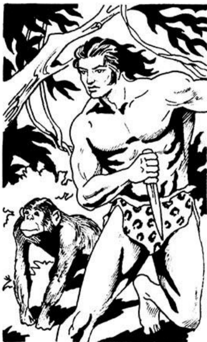
Σάν σίφουνας χάνεται έξω, στό τρομερό σκοτάδι τής νύχτας.

Μά τό σκοτάδι είναι πυκνό. Άκούει τήν άνάσα. Μά δέ βλέπει τό θεριό πού βρίσκεται άντίκρυ του.