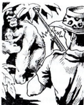
Είναι ένας τεράστιος, θηλυκός γορίλας μέ τό μικρό του.

Ξαφνικά, ό λευκός βλέπει κάτι πού τόν γεμίζει χαρά.