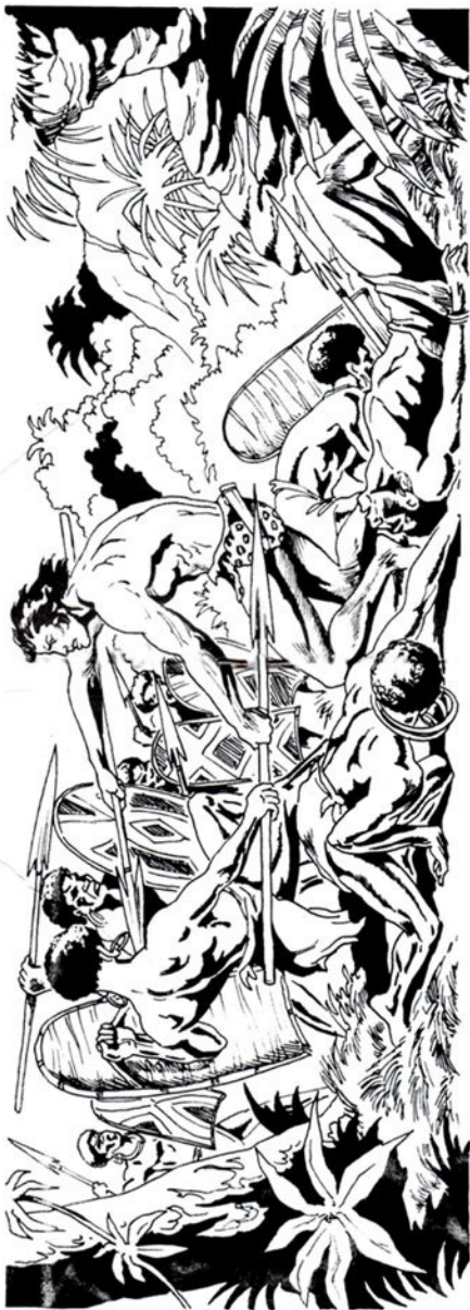
Αρπάζει από τους άγριους ένα κοντάρι κι αρχίζει να τους χτυπάει.