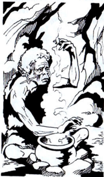
Ή Χούχ ρουφάει λαιμαργα τό μεθυστικό καπνό

- Ένας γιγαντόσωμος μελαψός άντρας. Είκοσι φορές λουλούδιασαν τά δέντρα άπό τότε πού γεννήθηκε. Τά μάτια του πετούν μαύρες άστραπές. Είναι όμορφος σάν τόν ήλιο. Έχει σιδερένιο κορμί. Ή φωνή του τρομάζει και τό