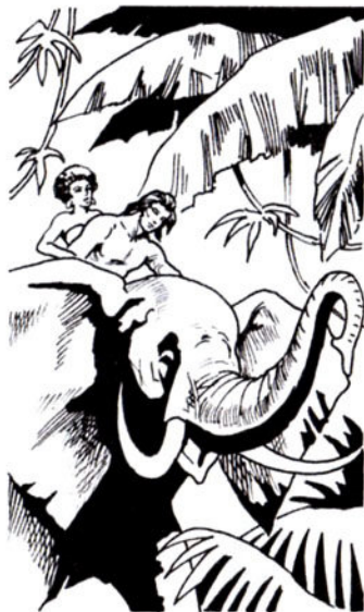
Ἄνεβαινουν κι οἱ δύο πάνω στή ράχη τοῦ ἔλεφанта.