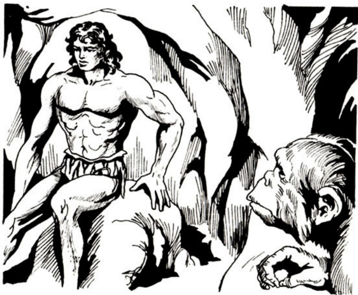
Στό βάθος ξεχωρίζει ένα γιγαντώσμο μελαψό άντρα.

Έ Ο κακός αυτός άνθρωπος θά σκοτώσει τή Ζολιάγκα. Πρέπει