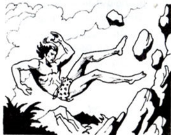
Ὁ Ταρζάν ἀρχίζει νά πέφτει στήν τρομακτική ἀβυσσο.

Κάπου ἐκεῖ κοντά, τό μάτι του ξεχωρίζει μιάν ἀητοφωλιά. Βρίσκεται ἀνάμεσα σέ δύο μεγάλους βράχους. Ἕνας τε-