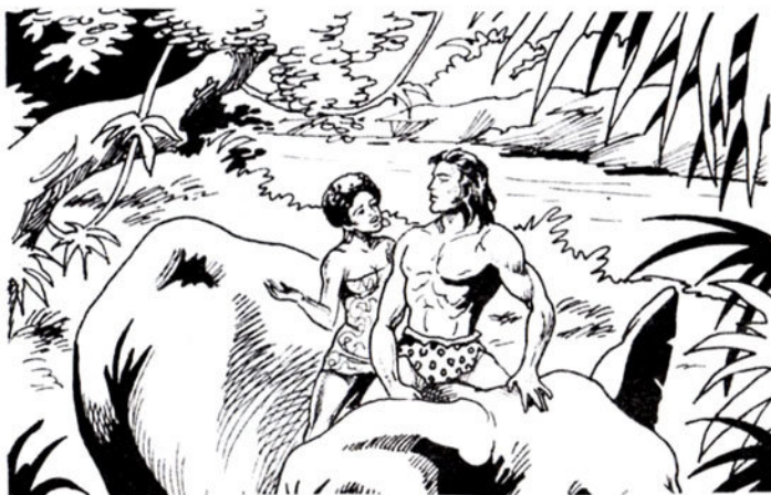
Ὁ Ταρζάν ἀκούει μέ συγκίνηση τά λόγια τῆς συντρόφισσάς του.

Ξυπνᾷ καί δέ μέ βλέπει κοντά του. Φωνάζει καί ψάχνει σάν τρελός νά μέ βρεῖ... Τέλος, φεύγει μουγκρίζοντας ἀπ' τό κακό του. Ξαφνικά, βλέπω πολλούς ἀνθρωποφάγους νά σέ φέρνουν δεμένο στήν ὄχθη. Ἄναβουν φωτιά. Καταλαβαίνω πώς θά σέ κάνουν θυσία στό Θεό. Βγαίνω ἀπ' τήν κρυψώνα μου. Κατεβαίνοντας, φτάνω στό στόμα του πέτρινου γίγαντα. Κι ἀπό κει ἀρχίζω νά φωνάζω στους κανίβαλους: Ἄφηστε τό λευκό! Οἱ μισοί ἀπό σᾶς θέλω νά κάψετε στη φωτιά τούς ἄλλους μισούς. Οἱ ἄγριοι νομίζουν πώς τούς μιλάει ὁ Θεός. Σέ ἀφήνουν πλάι στη φωτιά ἀναίσθητο. Κι ἀρχίζει μιά τρομερή πάλη μεταξύ τους. Ὁ ἕνας θέλει νά ρίξει στη φωτιά τόν ἄλλον. Καί σκοτώνονται.