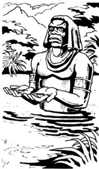
Ένας τεράστιος πέτρινος γίγαντας άπαίσιος καί τρομαχτικός

Έτσι προχωρεί στό βάθος τής λίμνης. Έη κωμικοτραγική άπόπειρα αυτοκτονίας συνεχίζεται.