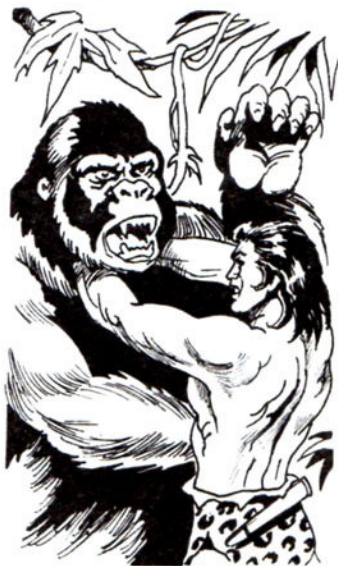
Σφίγγει τό λαιμό τοῦ πληγωμένου γο- ρίλα.