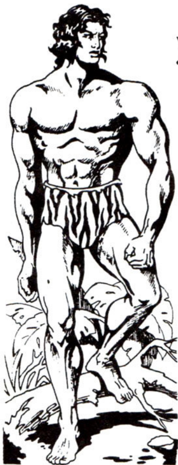
Ὁ μελαψός γίγαντας

Μιά νέα περιπέτεια γεμάτη δράση καί δυναμισμό! «Η ΠΑΓΙΔΑ ΤΟΥ ΘΑΝΑΤΟΥ»