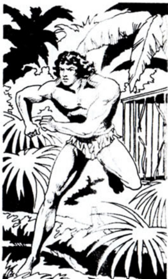
Κάποια νύχτα καταφέρνει να σπάσει τα σίδερα του κλουβιού.

Μένει αιχμάλωτος, κοντά τους, δυό όλόκληρα χρόνια. Στο διάστημα αυτό, οί λευκοί τόν δασκαλεύουν. Σιγά-σιγά, μαθαίνει καί τή γλώσσα τών ανθρώπων. Καταφέρνει τώρα