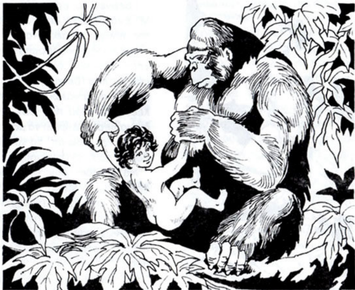
Ό μικρός ανατρέφεται σάν γορίλας.

Πηδώντας άπό δέντρο σέ δέντρο, τό φέρνει στή φωλιά της. Τό θηλάζει μέ τά στήθια της. Τό μεγαλώνει σάν δικό της παιδί. Τό αγαπάει σάν