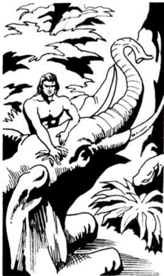
Βάζει θαυματουργά βότανα στήν πληγή τοῦ Σάμ.

Ἕνας μεγάλος βράχος χτυπάει μ' ἀφάνταστη ὀρμή τήν πέτρα πού κρατιέται ὁ Ταρζάν. Καί τή σπάει. Ἐτσι, ὁ ἄμοιρος τινάζεται στόν ἀέρα. Κι ἀρχίζει νά πέφτει στήν τρομαχτική ἄβυσσο.