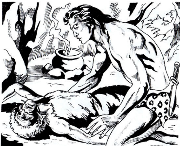
Βρίσκει τή μαύρη γερόντισσα νά ξεψυχᾷ.

Ἄς ἴδωμεν ἄρα. Ὁ Ταρζάν ξαναγυρίζει στή σπηλιά του. Ἐχει μιά ἐλπίδα. Μήπως ἡ Ζολιάγκα ξέφυγε ἀπ' τὰ χέρια τοῦ κακοῦργου. Μήπως εἶναι ἐκεῖ.