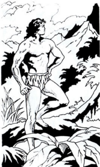
Διψάει νὰ μάθει τι βρίσκεται πίσω απ' τὰ γαλάζια βουνά.

Ἀπ' τὸν πατέρα του πήρε τὰ χαρακτηριστικά τοῦ λευκοῦ ἀνθρώπου. Καὶ στό πρόσωπο καὶ στό κορμί. Ὁ νέος νομίζει τὴ γορίλαινα πραγματικὴ του μητέρα. Τὴν ἀγαπάει ἀφάνταστα.