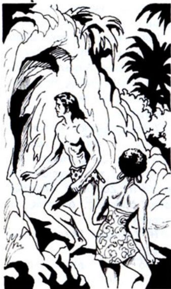
Ή Ζολιάγκα κι ό Ταρζάν φτάνουν στή σπηλιά τής μάγισσας.

Ξαφνικά, τά μάτια του Ταρζάν φωτίζονται παράξενα. Μιά φοβερή ύποψία περνάει άπ' τό νοϋ του.