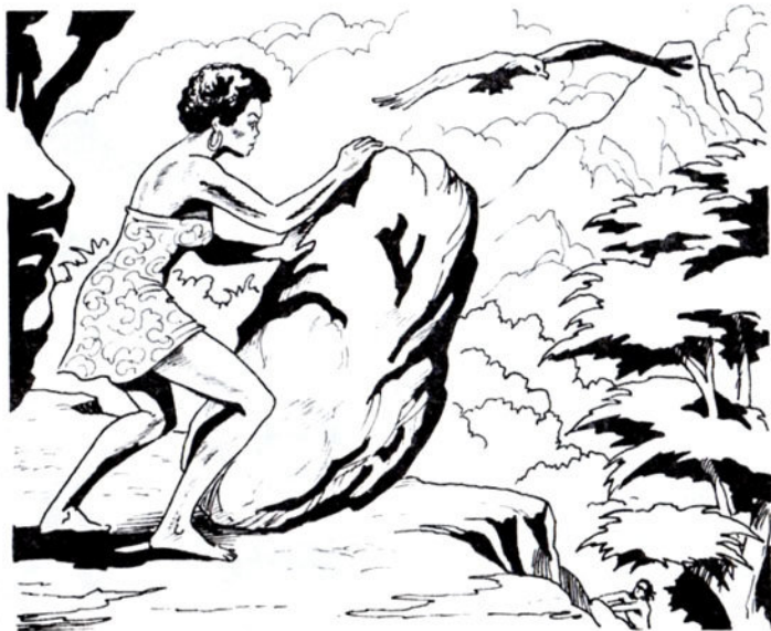
Κι άμέσως σπρώχνει ένα βράχο μέ τά γερά της μπράτσα.

- Μείνε νά κοιμηθείς έδώ, στή σπηλιά μου... Έγώ θά πάω πίσω άπ' τούς βράχους... Έκεϊ θά πλαγιάσω... Όταν βγει ό ήλιος, θά 'ρθώ νά sé πάρω... Πρέπει νά sé παραδώσω στά χέρια του Ταρζάν.