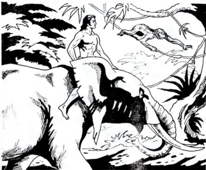
Μπροστά προχωρεί η Βάτ. Ο Ταρζάν με τον Σόμ ακολουθούν.