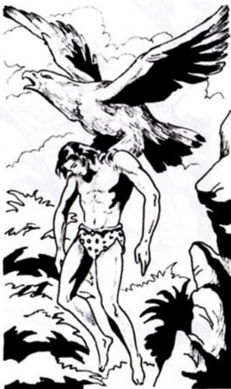
Τόν ἀρπάζει ἀπ' τούς ὤμους. Ὑστερα χαμηλώνει ἀργά.

Ὁ ἀήττος πού βρίσκεται ἐκεῖ, βλέπει τόν Ταρζάν νά πέφτει. Ἄνοιγει γρήγορα τίς φτερούγες του. Κατεβαίνει σάν βολίδα... Σάν κεραυνός!... Τόν ἀρπάζει στό πόδια του. Ὑστερα, χαμηλώνει ἀργά. Καί τόν ἀποθέτει μαλακά κάτω στό χῶμα. Εἶναι ἀναισθητός. Κάποια ὁμως ἀπ' τίς πέτρες πού κατρακυλοῦν, χτυπάει στό κεφάλι τόν Σόμ. Τόν τραυματίζει βαριά.