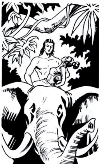
Παίρνει στά χέρια του τη μαύρη και φωνάζει κάτι στον έλέφαντα.

Δέν έχει καταφέρει νά χτυπήσει ούτε ένα ζαρκαδί.