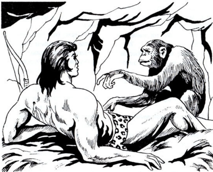
Πλησιάζει τόν Ταρζάν καί κάτι τοῦ λέει στή γλώσσα της.

Αὐτά ὅλα συλλογιέται ὁ Ταρζάν, ξαπλωμένος στά ξερά χορτάρια τοῦ σκοτεινοῦ παλατιοῦ του.