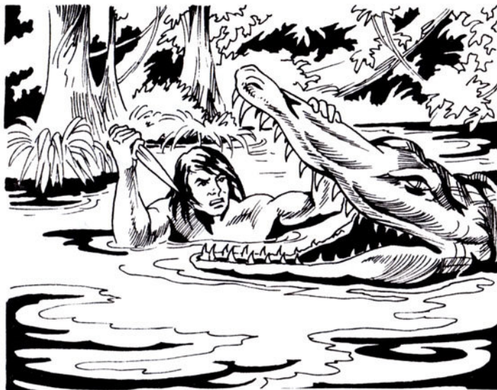
Ο Ταρζάν ρίχνεται και χτυπάει το δεύτερο θηρίο.

τά χέρια και τό κεφάλι του. Ἄπ' τήν ἄλλη, τά πόδια του.