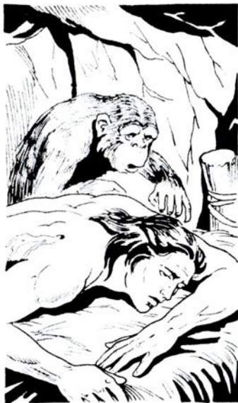
Πλάι στόν Ταρζάν παραστέκει ἡ μικρή μαιμούδιτσα Βάτ.

Καί χωρίς νά χάσει στιγμή δίνει μιά ἀπότομη σπρωξιά στό σύντροφό του. Πετάει κάτω τόν Ντάρ. Ἔτσι, τό λιοντάρι θά χορτάσει μ’ αὐτόν καί θά φύγει.