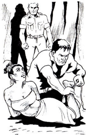
Ἡ Μπόρ τὴν πετάει κάτω. Μ' ἓνα σογι- νὶ τῆς δένει τὰ πόδια.

– Ἐγὼ δέ ζηλεύω. Θά εἶσαι πού δειλὸς ἂν στήν πάρει ὁ Μπόρ.