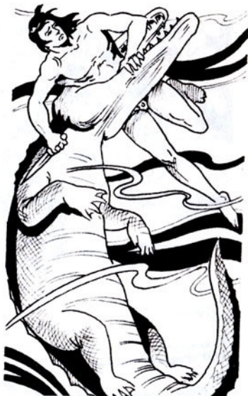
'Ο Ταρζάν γυρίζει τό δεξιό του χέρι πού κρατάει άκόμα τό μαχαίρι.

– Συγχώρεσέ με, Ταρζάν... Γιά ό,τι κακό έκανα, δέ φταίω εγώ. 'Η αγάπη πού 'νιωσα γιά σένα μόλις σέ είδα, θόλωσε τό νού μου... Πάρε με στη σπηλιά σου... 'Αλλιώς, κάρφωσε τό μαχαίρι σου στην καρδιά μου. Μακριά σου, ή ζωή δέ θά 'χει πιά γιά