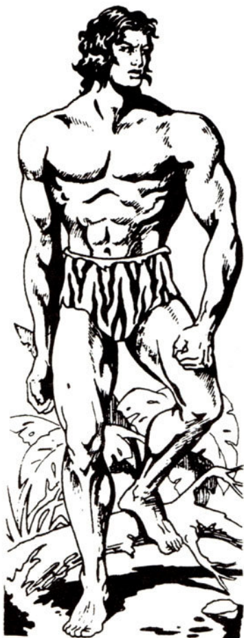
Ο μελαψός γίγαντας

Λίγα λόγια για τό τεύχος Νο 3 τῆς σειρᾶς ΓΚΑΟΥΡ – ΤΑΡΖΑΝ: Στήν περιπέτεια μέ τόν τίτλο « Ο Πέτρινος Γιγαντας », ἐμφανίζεται ὁ θρυλικός ΓΚΑΟΥΡ! Μήν τό χάσετε!