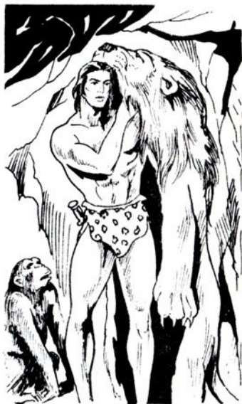
Ρίχνει στους γυμνούς ώμους του τό τομάρι τού λιονταριού.

σαινει βαριά. Μοιάζει σάν έτοιμοθάνατος.