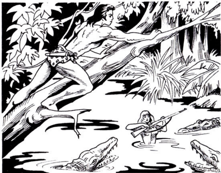
Πατώντας ἀπὸ κλαδί σὲ κλαδί, φτάνει πάνω ἀπ' τοὺς κροκόδειλους.

Τὸ τέρας ἔχει ἀρπάξει τὸν Ταρζάν ἀπ' τῆ μέση τοῦ κορμιοῦ του. Ἀπ' τῆ μιὰ μεριά ἐξέχουν