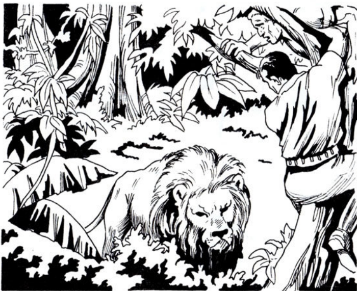
Τό λιοντάρι φτάνει κάτω άπ' τό μικρό δέντρο πού 'χουν σκαρφαλώσει.

Τό λιοντάρι φτάνει κάτω άπ' τό μικρό δέντρο πού 'χουν