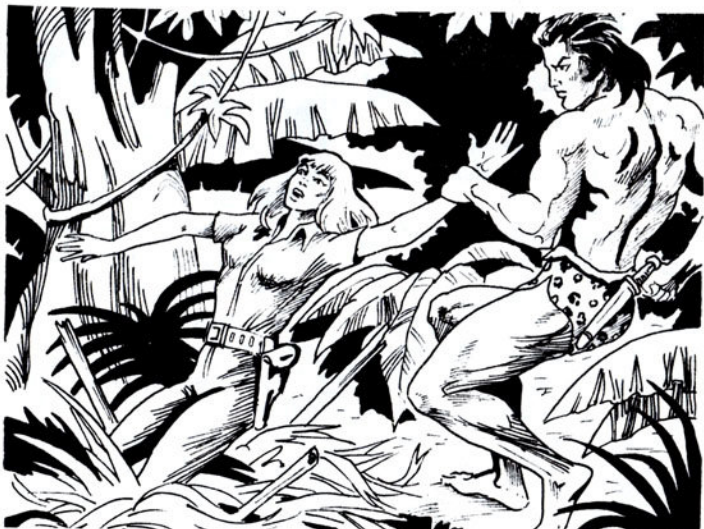
‘Ο Ταρζάν απλώνει τό χέρι του και τήν άρπάζει.

Χωρίς καθόλου νά σκεφτεί ό Ταρζάν, άκουμπάει τό κλαδί του στό δάπεδο τής παγίδας. “Υστερα, τό άγκαλιάζει και γλι-