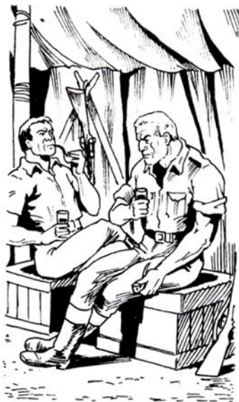
Στή σκηνή του Ντάρ κάθονται οι δυό κυνηγοί.

βγήκε νά περπατήσει γύρω στόν καταυλισμό... Τέσσερες ώρες πέρασαν... Νύχτωσε κι άκόμα νά φανεί... Σίγουρα, κακό θά 'παθε... Τί λές, Μπόρ;