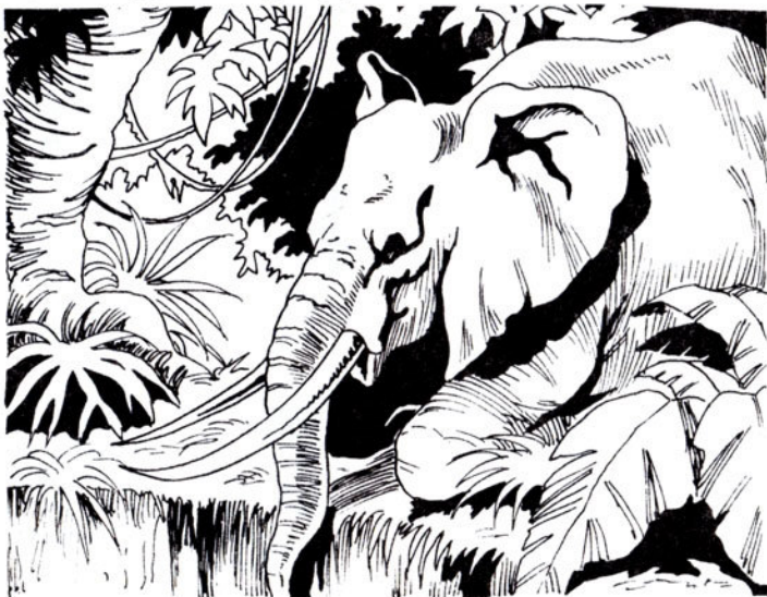
"Ο Σάμ σκύβει πάνω άπ' τήν παγίδα και κατεβάζει τήν προβοσκίδα του.

- "Όχι. Δέ θά πεθάνεις, της λέει. Σέ λίγο, ο Σόμ θά μάς φέρει στό χωριό σας. Θά σέ παραδώσω στούς δικούς σου. Κι αύτοί, μέ τά βότανά τους, θά σέ κάνουν καλά. Πές μου, όμως, πώς βρέθηκες στήν παγίδα.