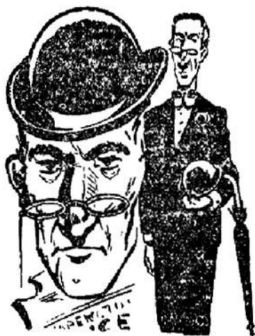
Ὁ ἐπιθεωρητὴς Μπέρμαν

κηρ ἔχεις... Ἄλλὰ μπορεῖς νὰ κάνῃς κάτι ἄλλο.