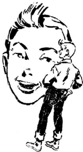
'Ο Μικρὸς Γιούπυ

— Μὰ αὐτὸ εἶπαι παράλογο μᾶτο, τὸν ἀντικρούει ἡ Τζὶν 'Ἀστορ.