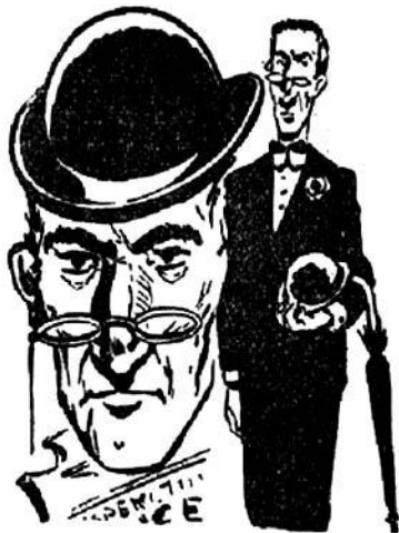
'Ο ἐπιθεωρητής Μπέριμαν

— Λαμπρά!, κάνει ὁ ἐπιθεωρητής. Τὸ τεσπὸν μετὰ τοῦ ὠφελίμου, δηλαδή. 'Ἐνα