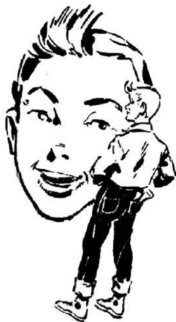
‘Ο μικρός Γιόπου

Τά μεγάλα μαύρα μάτια του δαιμόνιου ντέκτιβ λάμ