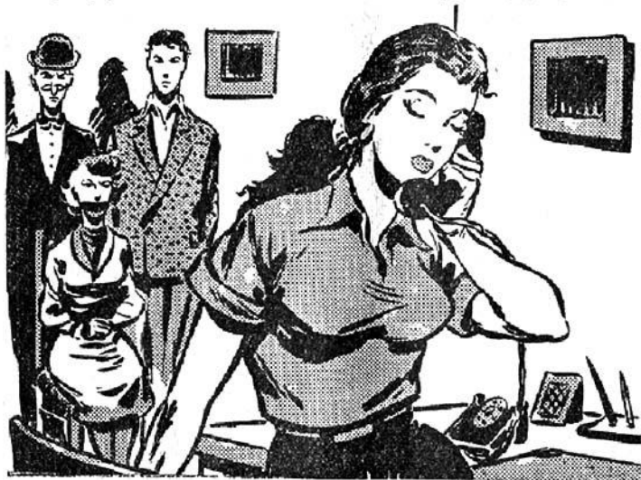
‘Η Τζίν ‘Αστορ ύποκρίνεται τή φωνή τής φιμωμένης γυναίκος.

— Γιατί τόπιασα, κύριε! Μάλιστα! Τόπιασα και τó κουνούσα λέγοντάς του με θυμό: «Φαίνεται πώς όλ’ αυτά τά πλούτη πού έχεις σωριά-