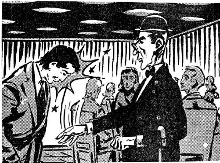
Ο Μπέρμαν δίνει στὸ διευθυντὴ ἕνα γερὸ χαστουκί.