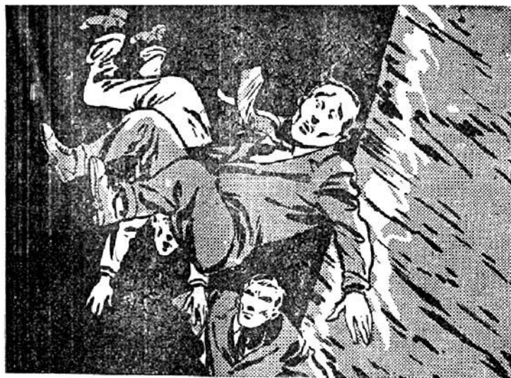
Οι επισκέπτες γκρεμοσκακίζονται στην καταπακτή.