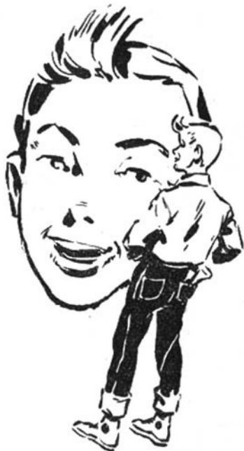
Ὁ μικρὸς Γιούπυ

— Ὁχι. Ἡ δική μου ἦταν πράσινη. Πάντως ἕνα σᾶς λέω νὰ με πιστέψετε: Μπορεῖ ὁ διάβολος νὰ τῶφερε νὰ μοιάζουμε τόσο πολὺ μ' αὐτὸ τὸ μασκαρά. Εἶναι ὅμως ἀδύνατο νὰ λεγόμεστε κι' οἱ δυὸ Χάρρυ Μίλλορ, νάχουμε γεννηθῆ κι' οἱ δυὸ τὸ 1907, νάμαστε κι' οἱ δυὸ μεταπράτες, νὰ μένουμε στὸ ἴδιο σπίτι, νάχουμε παντρευτῆ τὴν ἴδια