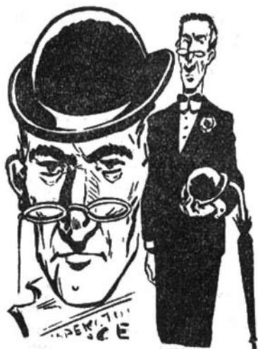
‘Ο ἐπιθεωρητὴς Μπέριμαν

Δὲν περνοῦν μερικά δευτερόλεπτα κι’ ὁ ἦχος ἐνὸς βομβητοῦ εἰδοποιεῖ τώρα τὸν Γιούπυ πῶς κάποιος καλεῖ τὸ τηλέφωνο τῆς Τζιν “Αστορ. ‘Ο διεισδυόμενος πιστωρὸς ἔχει ἀνακαλύψει τὴν κρυφὴ ἔνωση τῆς δημοσιογράφου κι’ ἔχει καταφέρει νὰ κἀνῃ κι’ αὐτὸς μιὰ ἴδια στὸ δικὸ της τηλέφωνο. Χωρὶς βέβαια νὰ ξέρη τίποτα ἀπὸ ὅλα αὐτὰ ὁ ντέτεκτιβ. “Εχει μάλιστα τὸ τοθετήσει κι’ ἕνα μικροσκοπικὸ κρυφὸ διακόπτη τοῦ βομ-