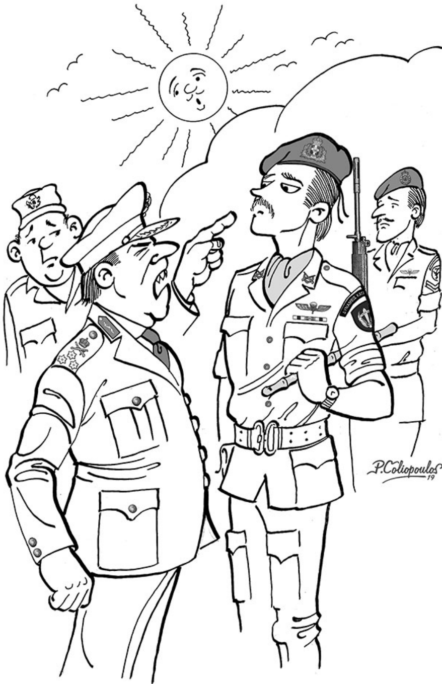
Η Γκάφα του Στρατηλάτη