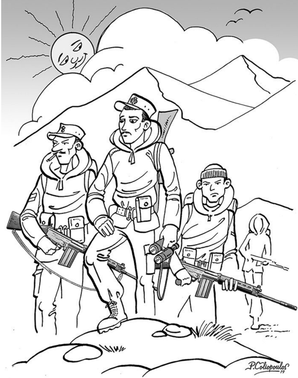
Περίπουλο στο Τίποτις